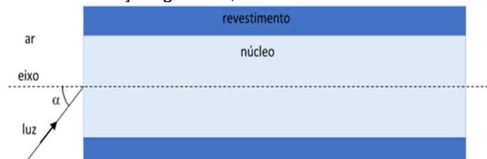
Imagem: Equipe ONC

O esquema abaixo mostra o perfil de um tubo cilíndrico preenchido com fibra de vidro simulando um trecho de fibra óptica. Neste esquema, a luz incide em um núcleo cilíndrico que é envolvido por um revestimento. O núcleo possui índice de refração igual a 1,40 e o revestimento possui um índice de refração igual a 1,26.